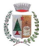
Comune di Ronzone